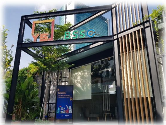
호치민 IT지원센터 입구