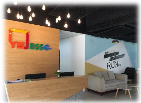
안내데스크 및 휴게소