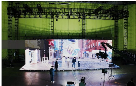
LED XR Stage