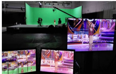
특수 촬영 스튜디오