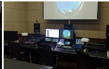
360 VR 녹음스튜디오