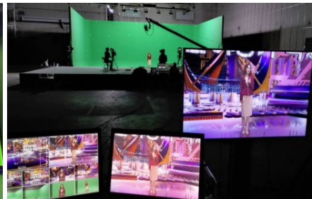
특수 촬영 스튜디오