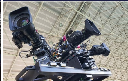
12K 실사 촬영 장비