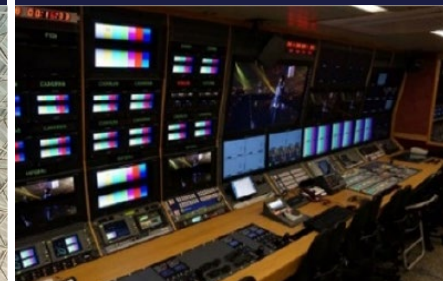
5G 멀티스트림 중계차