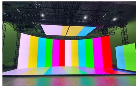
LED XR Stage