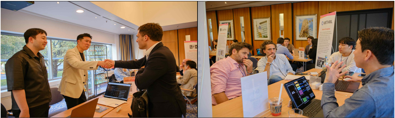
▲ [Day 2] 기업 1:1 비즈니스 미팅