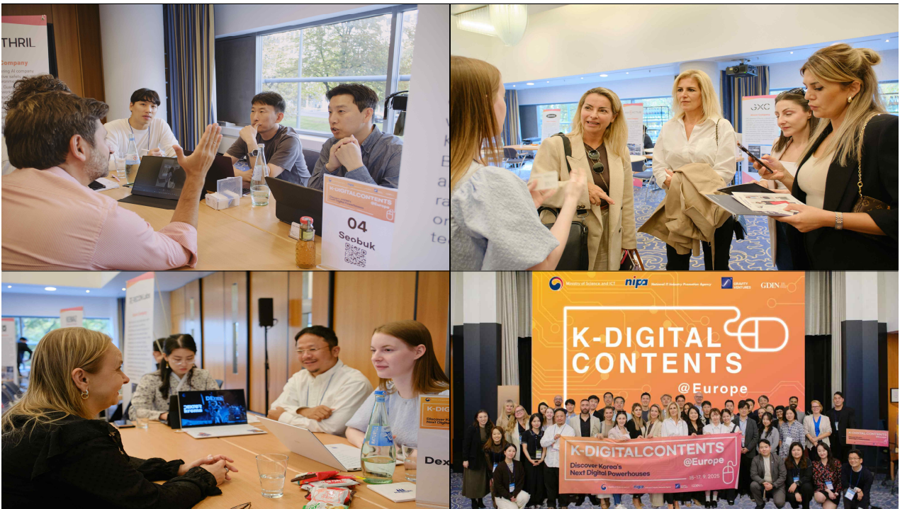
▲ [Day 3] 기업 1:1 비즈니스 미팅 및 네트워킹