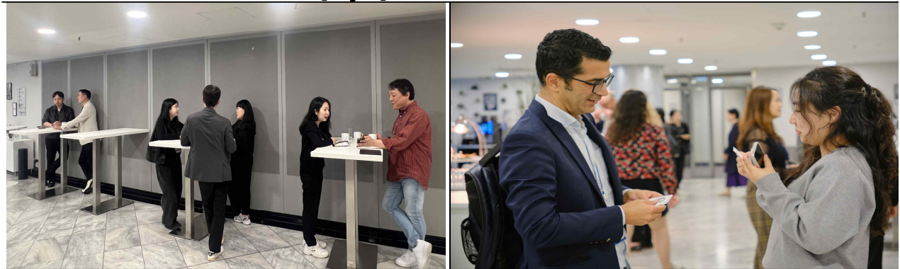
▲ [Day 2] 기업 1:1 비즈니스 미팅 및 네트워킹