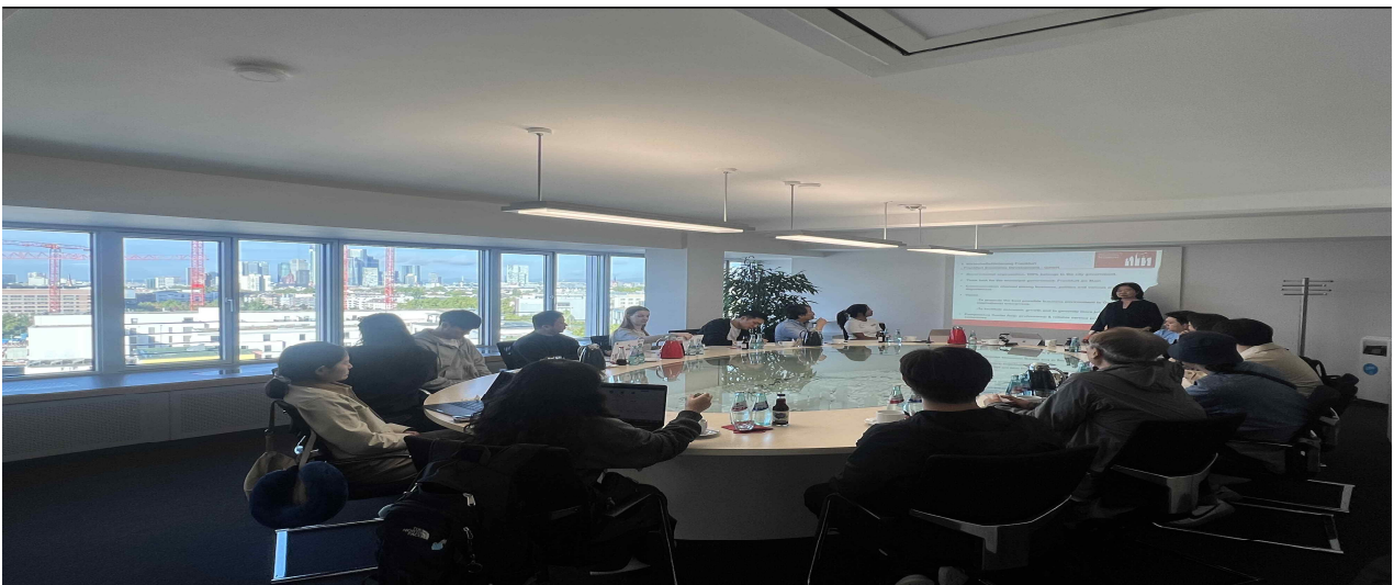
▲ [Day 4] 기관 방문 및 네트워킹