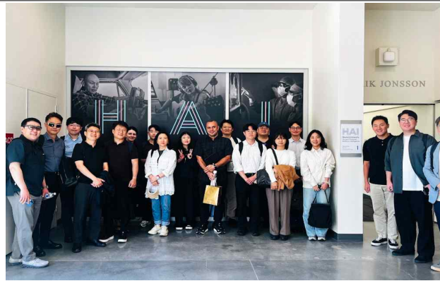
스탠포드대학교 HAI 방문