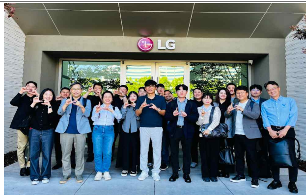
현지 기업(LG NOVA) 방문