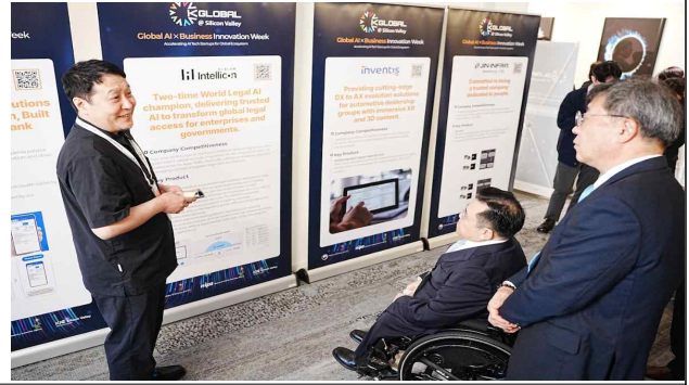
K-Global@SV 기업 홍보