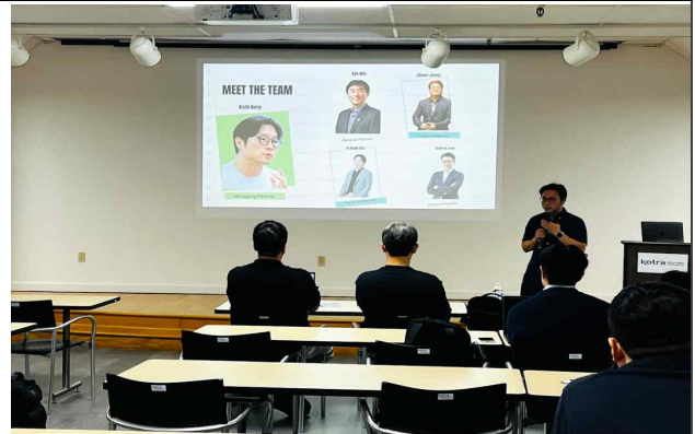
KIC 실리콘밸리 강연