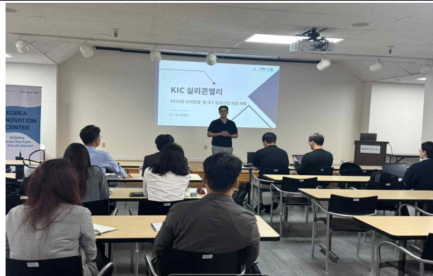
KIC 실리콘밸리 프로그램 안내