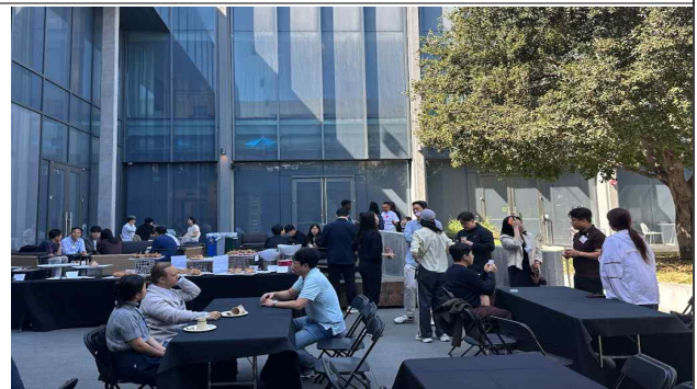
Google Cloud 네트워킹