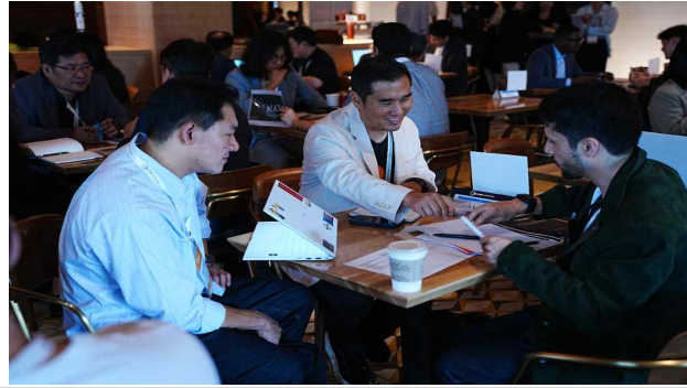
K-Global@SV 1:1 Meetup