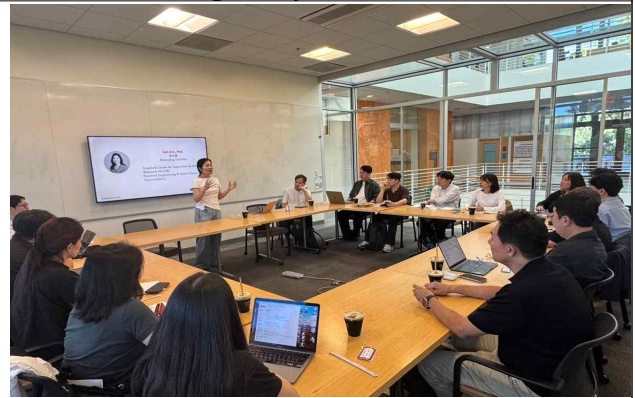
스탠포드대학교 d.school 방문