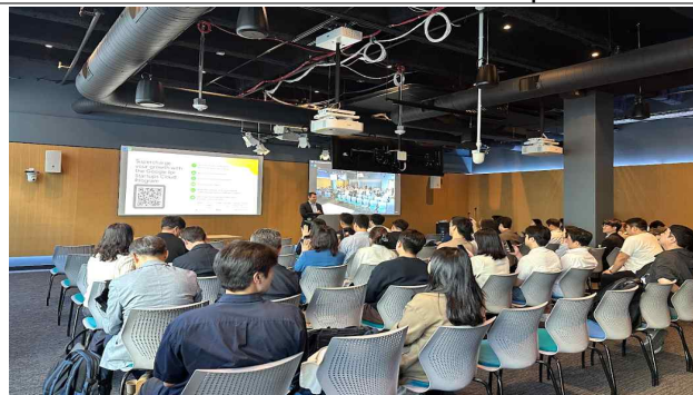
Google Cloud 포럼