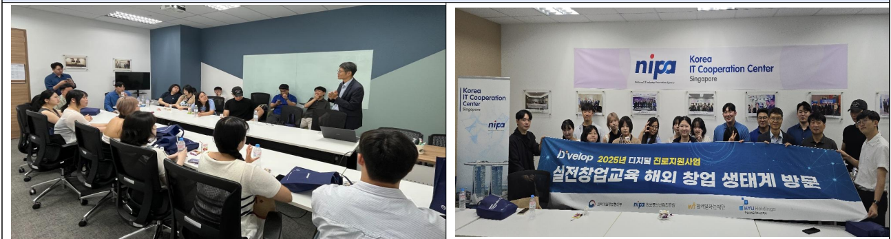
정보통신산업진흥원 싱가포르 IT 지원센터 방문