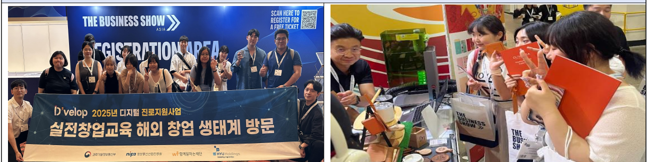
The Business Show Asia 2025